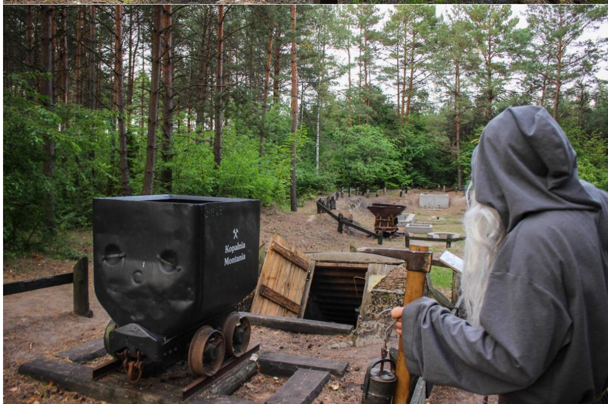
Ryc. 1-2. Rekonstrukcja Kopalni Montania

Źródło: www.kujawsko-pomorskie.travel/pl/gornicza-wioska-pila-mlyn-0 [15.04.2019].