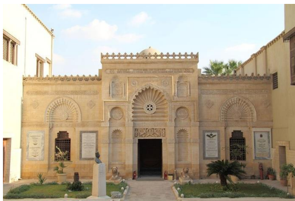
Ryc. 8. Muzeum Koptyjskie w Kairze – wejście główne

Najwięcej pozytywnych opinii o mieszczącym się w Kairze Muzeum Koptyjskim (ryc.8.) dotyczyło wyjątkowości przedstawionych zbiorów, a więc sztuki związanej z religią koptyjską. Dla turystów to bardzo interesujący, ale niezbyt oczywisty temat, gdyż Egipt kojarzony jest przede wszystkim z islamem, który został zaimplementowany w VII wieku i obecnie wyznaje go ponad 90% obywateli tego kraju. Natomiast religia koptyjska jest dużo starsza i wywodzi się właśnie z Egiptu, obecnie Koptowie stanowią mniejszość religijną.