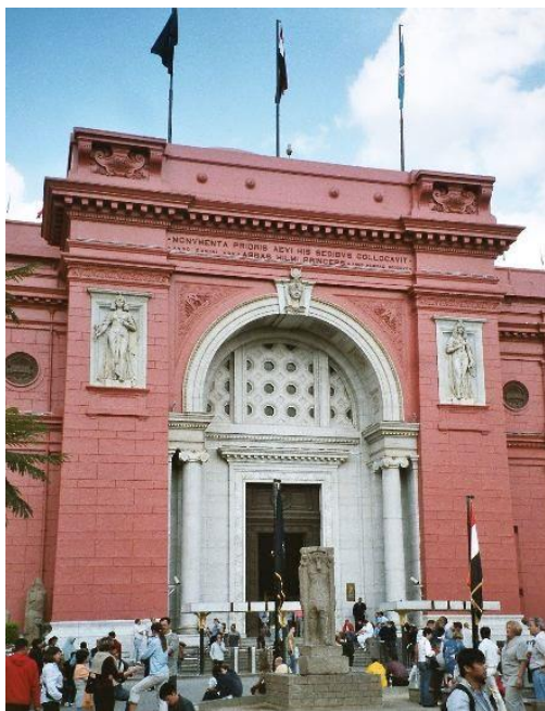
Ryc. 3 Główne wejście do Muzeum Egipskiego w Kairze

100 dolarów. Uświadomiłam sobie to dopiero później, co zrujnowało całe wspomnienie wizyty w muzeum” [1 sierpnia 2018, tłumaczenie własne].