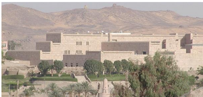
Ryc. 6. Muzeum Nubijskie w Asuanie