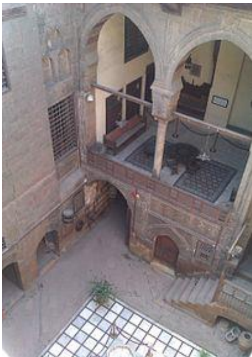
Ryc. 9. Dziedziniec Muzeum Gayer-Anderson

przystanków i nie zadajesz pytań. Następnie przechodzisz przez „muzea” (musisz zapłacić za nie w ramach wstępu).. Pokoje są bardzo małe i (ogólnie) składają się ze złych replik i dioram. Nie ma nic autentycznego, a dioramy składają się ze źle zrobionych lalek. Jediną ciekawą rzeczą w tym miejscu jest rejs jachtem wzdłuż Nilu (za dodatkową opłatą)” [7 listopada 2017, tłumaczenie własne].