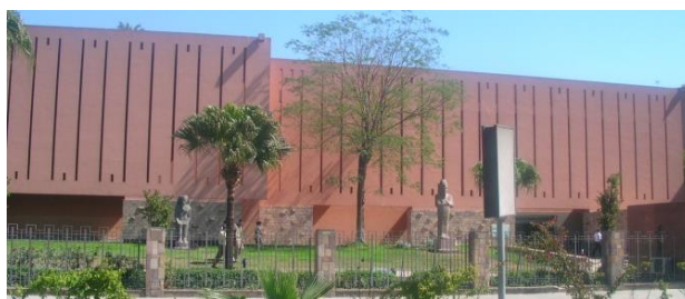
Ryc. 4 Fasada Muzeum Sztuki Starożytnej w Luksorze

Luksorskie Muzeum Sztuki Starożytnej (ryc.4.) jest muzeum archeologicznym zlokalizowanym pomiędzy innymi popularnymi atrakcjami turystycznymi: Świątynią w Luksorze i Świątynią w Karnaku. Użytkownicy pozytywnie odnoszą się do siedziby muzeum i organizacji ekspozycji: