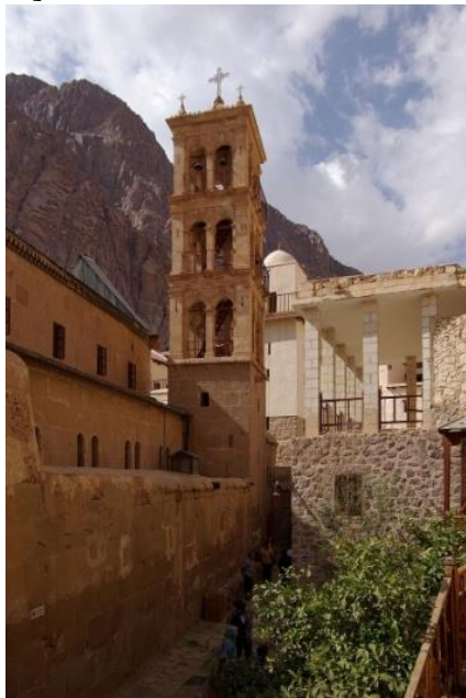
Ryc. 7. Klasztor Świętej Katarzyny

„ Rozczarowanie: Jedno nudniejszych miejsc jakie odwiedziłem, rozczarowanie gorącym krzewem i Studnią Mojżesza. Jeżeli dla kogoś stanowi to wartość duchową to zachwalać nie trzeba, ale przyjazd w góry tylko do tego klasztoru to pomyłka. Góra Synaj za to na 5+ a klasztor traktował bym jako dodatek do tej wyprawy” [22 sierpnia 2018].