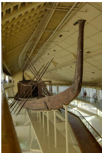
Ryc. 5. Zrekonstruowana łódź solarna. Muzeum Łodzi Solarnej w Gizie

„Dwie gwiazdki za tanią naprawę: Gdy w końcu dotarliśmy do Gizy zamiast do piramid weszliśmy do Muzeum Łodzi Solarnej. Łódź jest niesamowita, starożytni Egipcjanie byli prawdziwymi mistrzami, także w budowaniu łodzi. Historia znalezienia łodzi jest bardzo ciekawa, warto poświęcić czas na dokładne zapoznanie się z nią. Teraz, co mi się nie podobało. Pamiętajmy, że ta łódź ma przynajmniej 4 000 tysięcy lat. Spacerując wokół eksponatu zauważyłem, że po prawej stronie dziobu jedna z desek poluzowała się i wystawała. Jestem pewien, że starożytni konstruktorzy, byliby zachwyceni, gdyby zobaczyli jak współcześni naprawili tę usterkę, otóż załatwili to przy pomocy taśmy klejącej!. Poważnie? Taśma klejąca podtrzymująca deskę liczącą 4 000 tysięcy lat? Czy to jakiś żart? Chyba muzeum powinno przekazać opiekę nad tymi artefaktami jakiejś prywatnej firmie, najlepiej zachodniej lub europejskiej, bo to ich luźne podejście „inshallah” do konserwacji spowoduje, że łódź ulegnie bezpowrotnie zniszczeniu. TAŚMA KLEJĄCA? POWAŻNIE?” [3 października 2017, tłumaczenie własne].