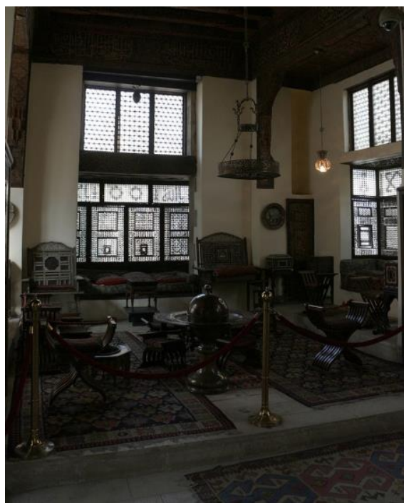
Ryc. 10. Wnętrze Muzeum Gayer-Anderson Źródło: https://commons.wikimedia.org (dostęp: marzec 2019).

Źródło: https://commons.wikimedia.org (dostęp: marzec 2019).