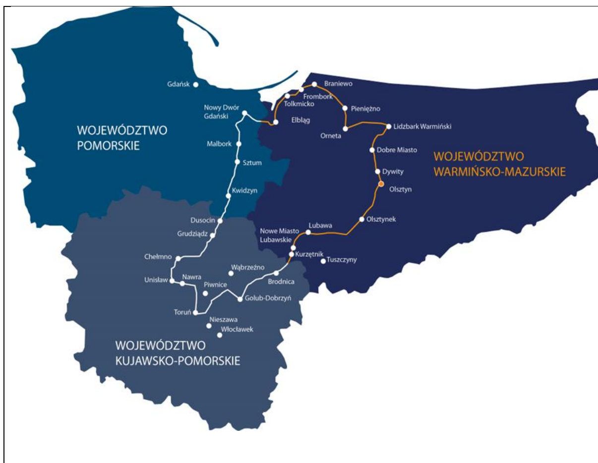
Rycina 2. Schemat przestrzenny Szlaku Kopernikowskiego i jego trasa samochodowa (stan: 1.10.2023).

prowadzące do opisów, w których ramach znajdują się (o ile istnieją) odniesienia do osoby Kopernika i jego związków z miejscem.