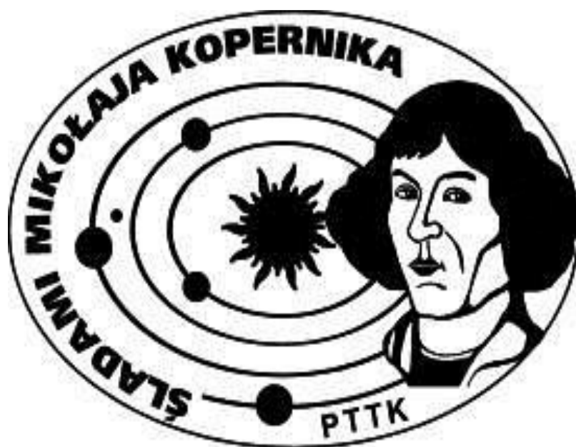
Rycina 3. Odznaka turystyczno-krajoznawcza Śladami Mikołaja Kopernika