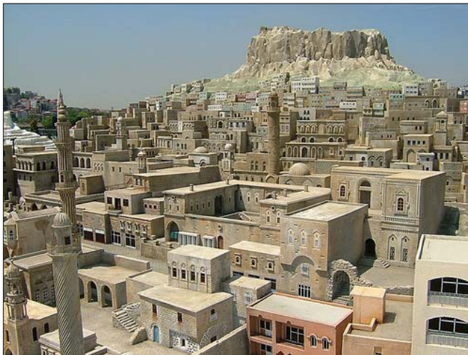
Fot. 1. Widok ogólny na Mardin. W tle na wzgórzu cytadela.

Mardin jest prastarym miastem, pamiętającym – jak większość osad położonych w Południowo-Wschodniej Anatolii – początki cywilizacji. To piękna starożytna miejscowość z cytadelą górującą nad rozległymi, spalonymi słońcem równinami Mezopotamii i Syrii (fot 1). Tuż pod cytadelą znajduje się najważniejszy zabytek miasta – Isa Bey Medresi – zbudowana w 1385 r. medresa, do której prowadzą wysokie schody.