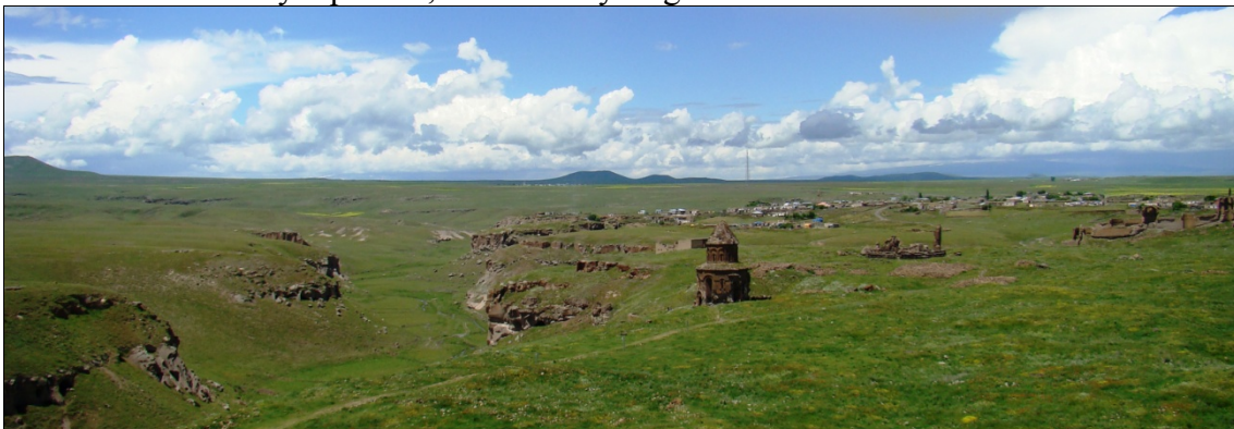
Fot. 3. Ruiny Ani.

„Miasto tysiąca i jednego kościoła” – Ani – to zrujnowane i opuszczone miasto w prowincji Kars na wschodzie Turcji, odzwierciedlające tragedię narodu ormiańskiego (fot. 3). W czasach swojej świetności była to przepiękna stolica Armenii licząca od ponad 100 do ok. 200 tysięcy mieszkańców, która swoją potęgą i atrakcyjnością nie ustępowała ówczesnemu Konstantynopolowi, Kairowi czy Bagdadowi.