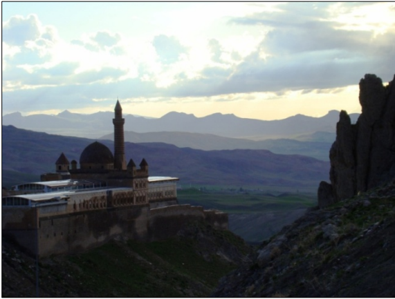
Fot. 2. Widok na Ishak Paşa Sarayı .

z umieszczonymi wokół nich budynkami różnorakiego przeznaczenia. Część mieszkalna pałacu Ishak Paşa składa się z dwóch pięter, na których usytuowano ponad 300 pomieszczeń, zaś w każdym z nich pierwotnie znajdował się kamienny kominek. Wnęki w kamiennych ścianach natomiast wskazują na to, iż budynek jako całość posiadał system centralnego ogrzewania, a także kanalizację i bieżącą wodę.