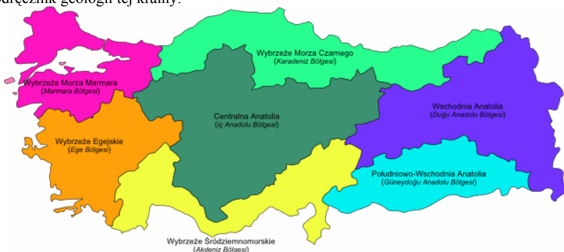
Mapa 1. Podział Turcji na regiony geograficzno-klimatyczne.